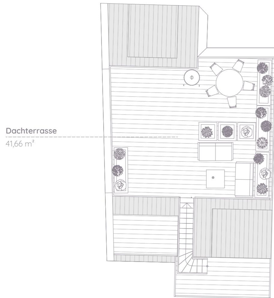
Dachterrasse 41,66 m 2